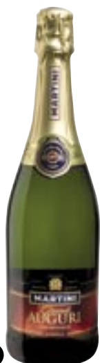
★● Martini & Rossi Spumante dolce Grandi auguri 3,80 euro